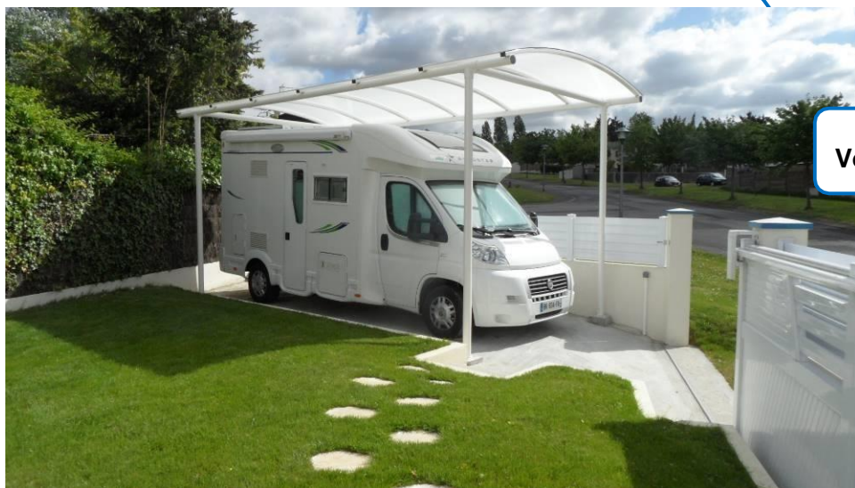
Visuel non contractuel